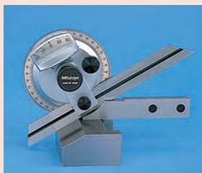
187-901 с увеличительным стеклом

187-105 стандартная принадлежность для 187-901